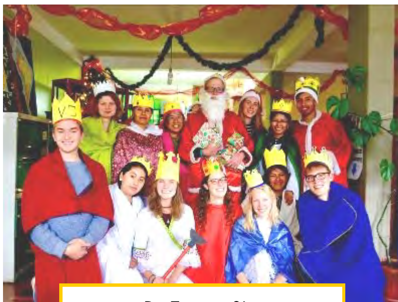
Das Team 2018/19 in weihnachtlicher Stimmung

„Ich hatte zu Anfang etwas Sorge, dass es mit so vielen Deutschen schwieriger wird, die Sprache zu lernen/zu verbessern und die Kultur Boliviens kennenzulernen. Auch in Bezug auf die Freiwilligen habe ich mir die Frage gestellt, ob es nicht wirklich sehr viele zusätz-