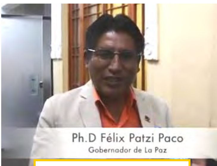
Glückwünsche an die Schuhputzer

Politisch kaum beachtet, aber für unsere Zielgruppe von großer Bedeutung ist der 02. Dezember, der „Tag der Schuhputzer“. Um diesen Tag auch in der Öffentlichkeit bekannt zu machen und die Arbeit der Schuhputzer zu würdigen, drehte Anton ein Video mit Glückwünschen an die Schuhputzer. So gab es Grüße von den Geschäftsführerinnen von VAMOS JUNTOS